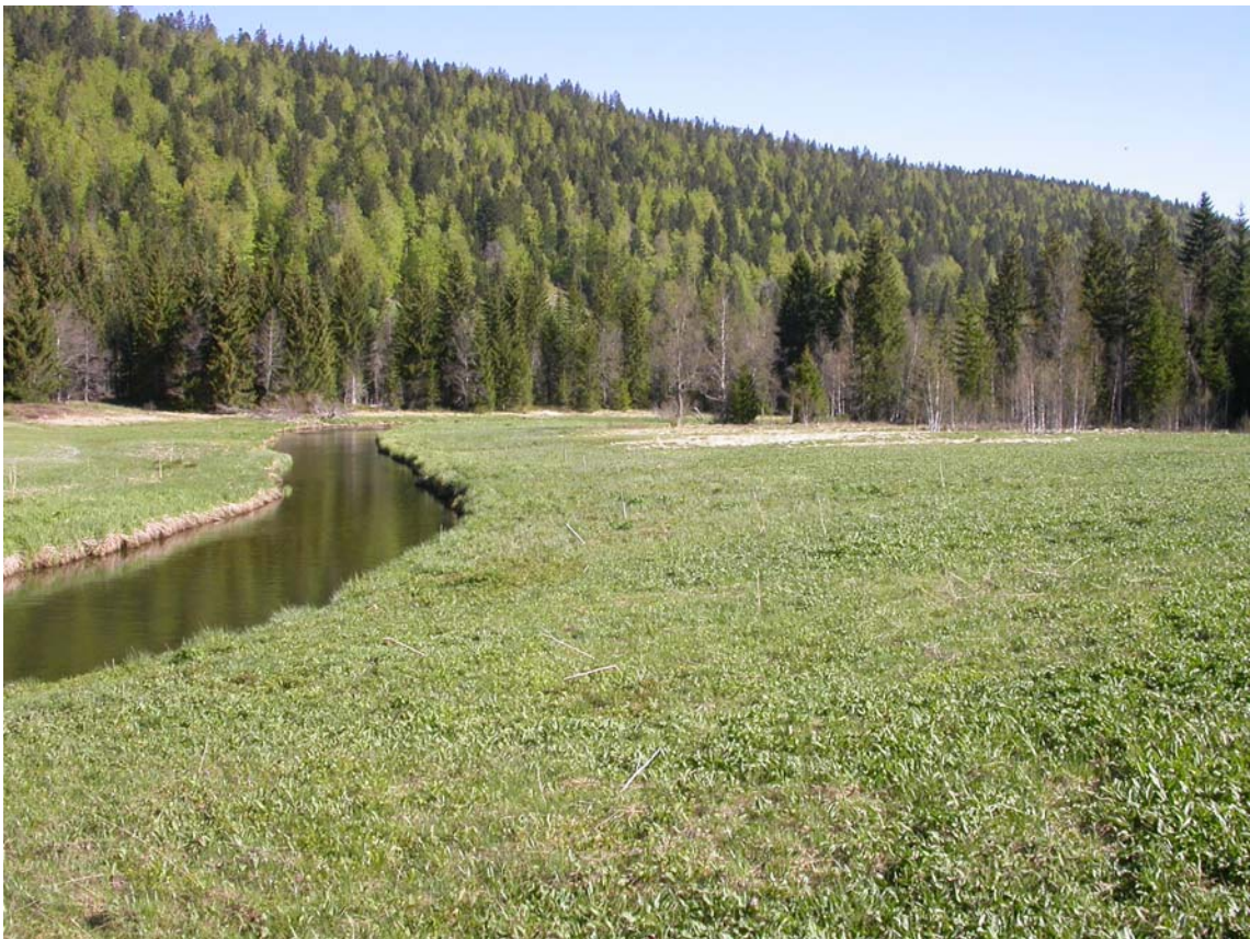
Regard contre la partie aval de la Vallée.