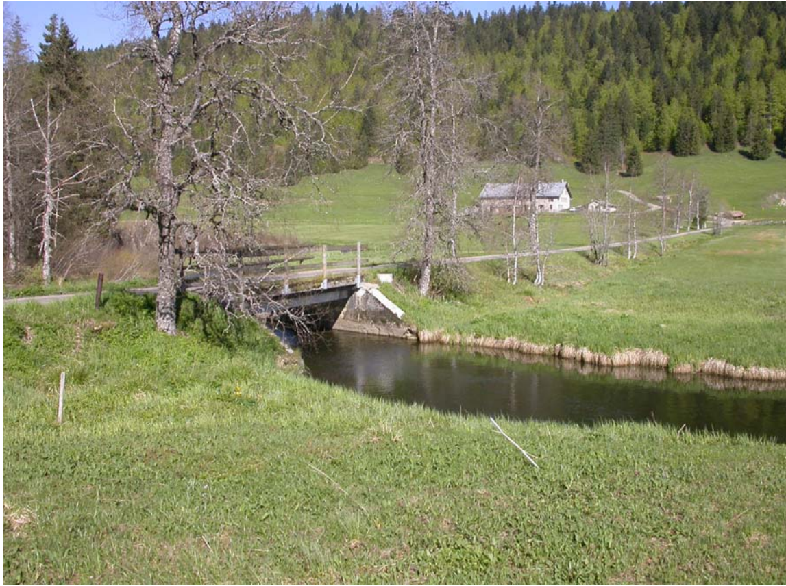
Pont du Carroz. A l'arrière-plan, sur la rive gauche de l'Orbe, le chalet de Praz-Rodet.