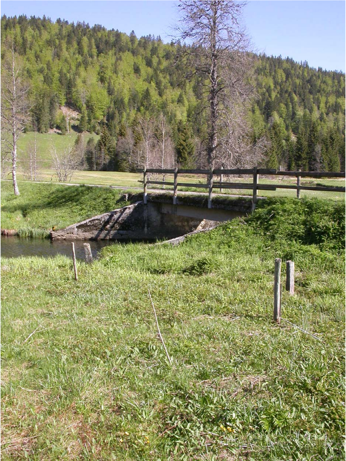
Le pont de Praz-Rodet en l'état actuel.