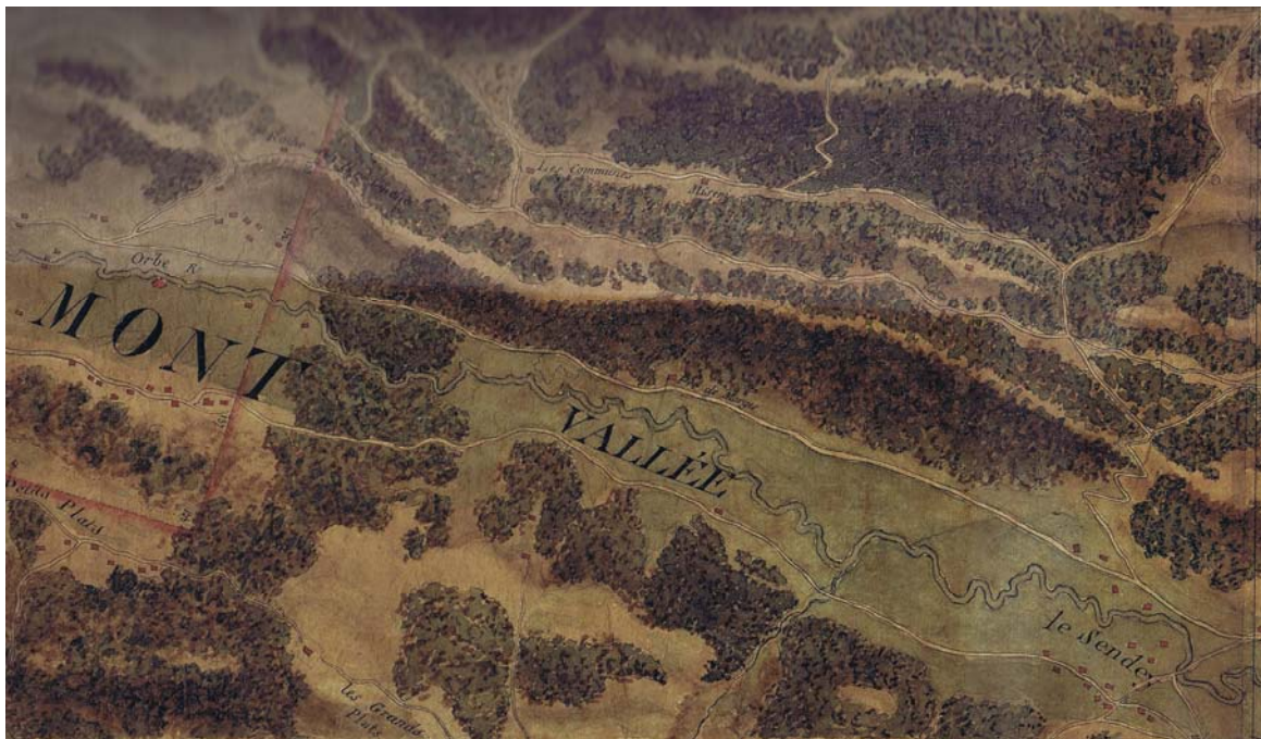
Carte IGN de 1785. Pas de pont du l'Orbe au niveau de Praz-Rodet. Les cartographes l'ont tout simplement négligé.